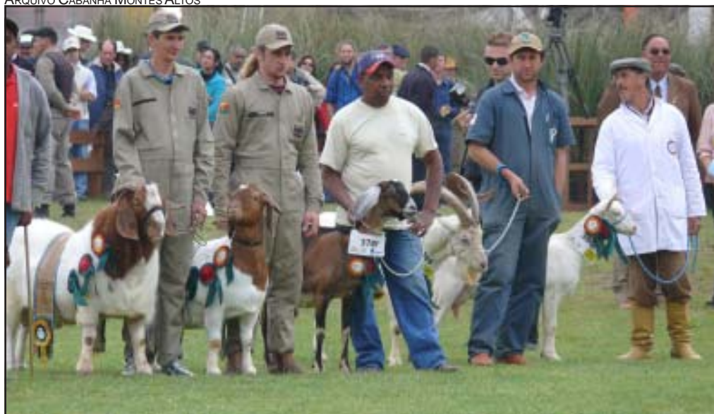
Foto do Desfile dos Campeões (da esquerda para a direita): Animais da Raça Boer da Cabanha Montes Altos, Saanen e Anglonubiana da Cabanha PG e Saanen da Cabanha Duplo R.